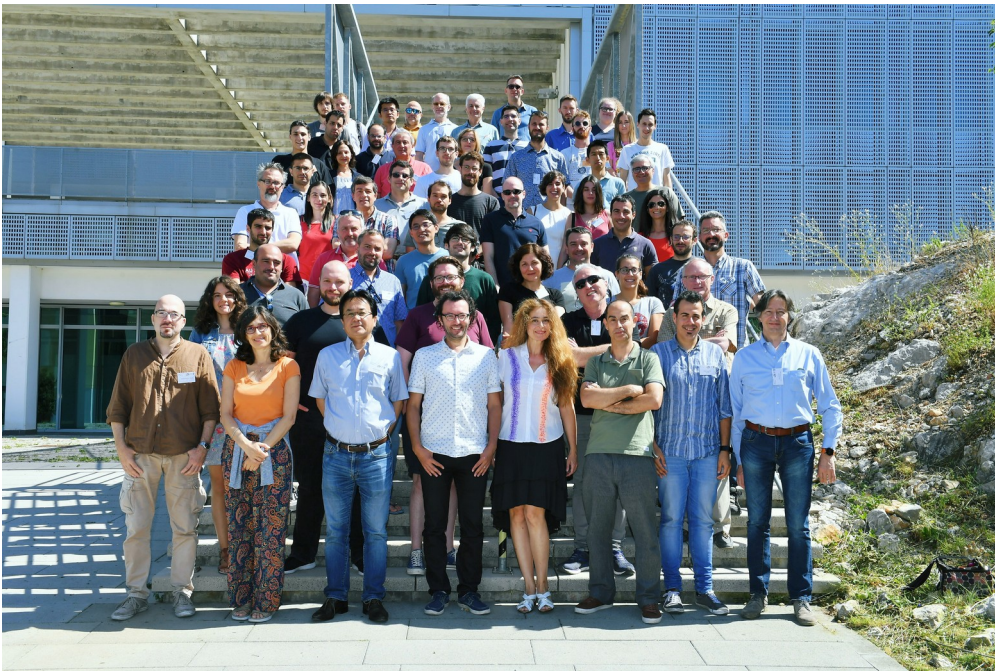
Grupna slika članova kolaboracije CTA-LST tijekom sastanka na Odjelu za fiziku.