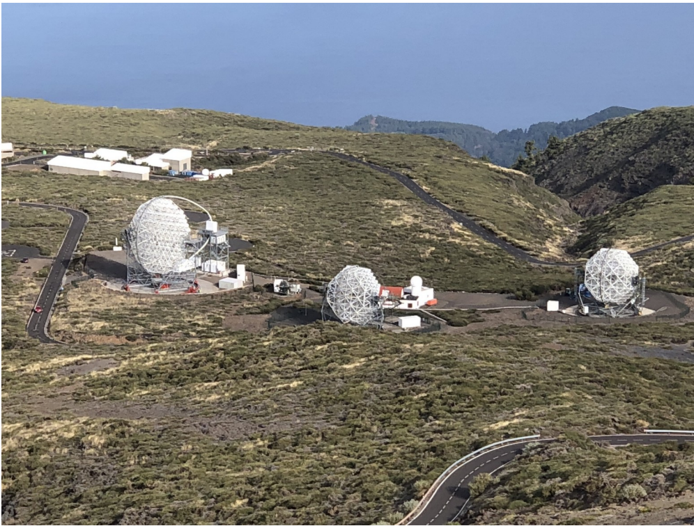
Observatorio del Roque de los Muchachos s teleskopima (s lijeva na desno) LST-1, MAGIC 2, MAGIC 1.